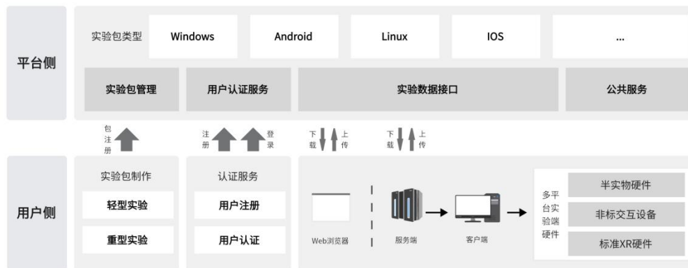
图1 信息交互流程和系统组成示意图